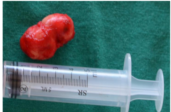
Figura 2. Lesión encapsulada, bien definida.

Con respecto a la evolución de la paciente se constata en el pos operatorio inmediato parálisis facial periférica lado izquierdo; con recuperación completa a los 3 meses de acompañamiento de rehabilitación física indicada de manera precoz.