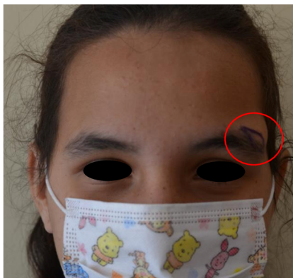
Figura 1. Tumoración ovalada bien delimitada.

Presenta hemograma con crisis sanguínea normal; ecografía de piel y partes blandas informó imagen compatible con quiste sebáceo, y la radiografía de cráneo no mostró alteraciones.