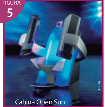
Cabina Open Sun